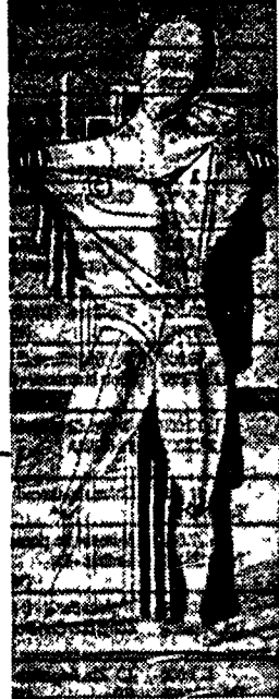
Giorgio de Chirico, «Il Trovatore solitario», 1970 (particolare)

Lunga carrellata sull'ultima produzione di Giorgio de Chirico