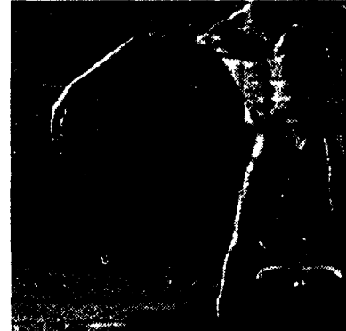
Da «Hegira» di Lisa Dalton e Austin Hartel