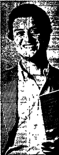
Il compositore Paolo Arcà

La solitudine di Orlando nei suoni nuovi di Paolo Arcà