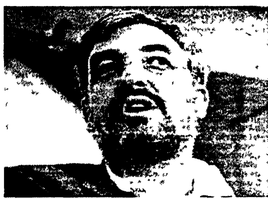
Raffaele Morese, segretario confederale della Cisl