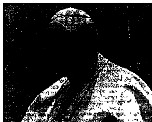
Giovanni Paolo II