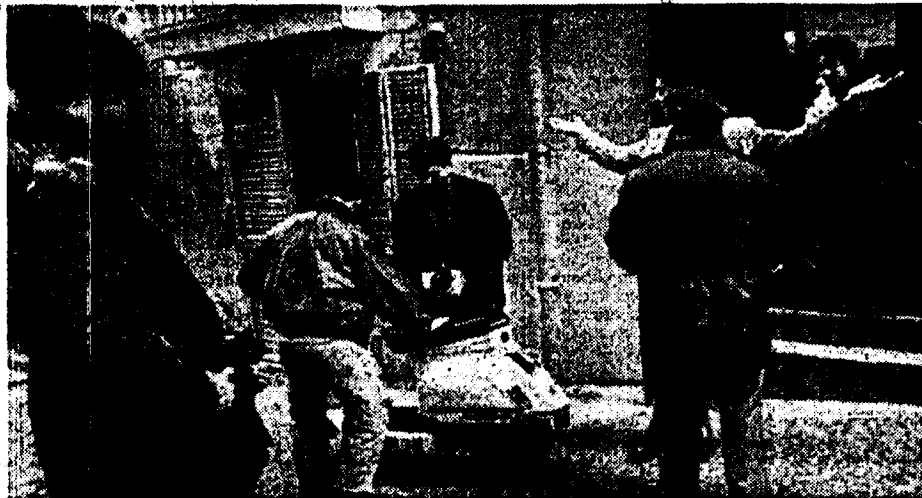
Un controllo della polizia nei quartieri Spagnoli a Napoli