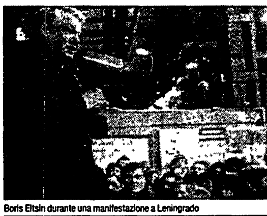
Boris Eltsin durante una manifestazione a Leningrad

stema computerizzato, attraverso cammini faticosi al lato dei binari. Ogni tanto si incontrano dei rilevatori di gas matano Porte pesanti impediscono che l'aria relativamente buona prodotta dal sistema di ventilazione si mescoli con l'aria satura di altre gallerie.