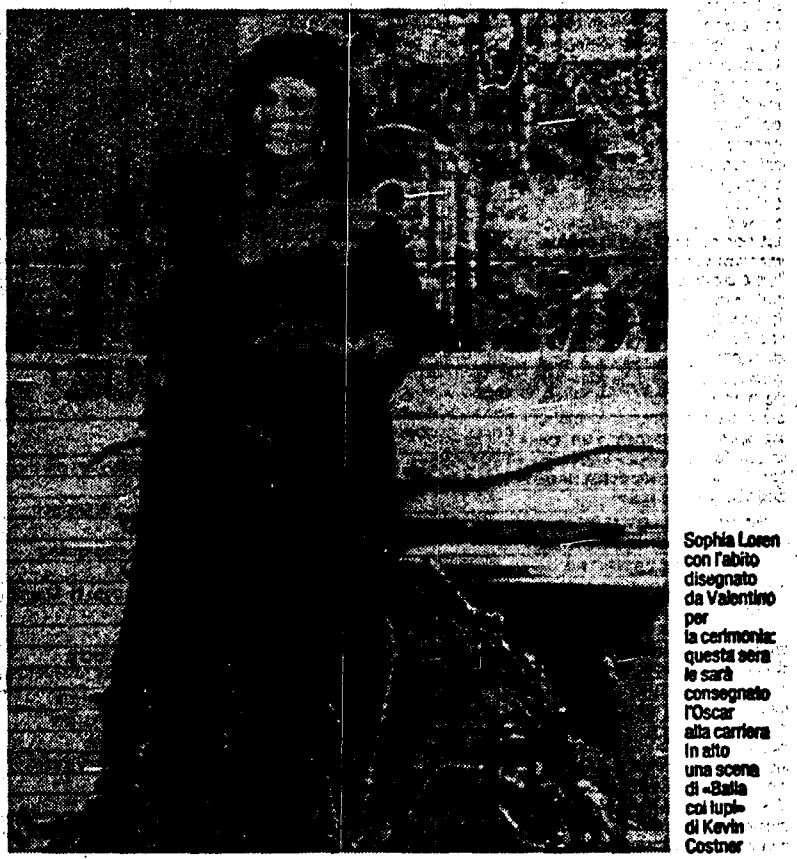
Sophia Loren con l'abito disegnato da Valentino per la cerimonia: questa sera le sarà consegnato l'Oscar alla carriera in atto una scena di «Balla coi lupi» di Kevin Costner