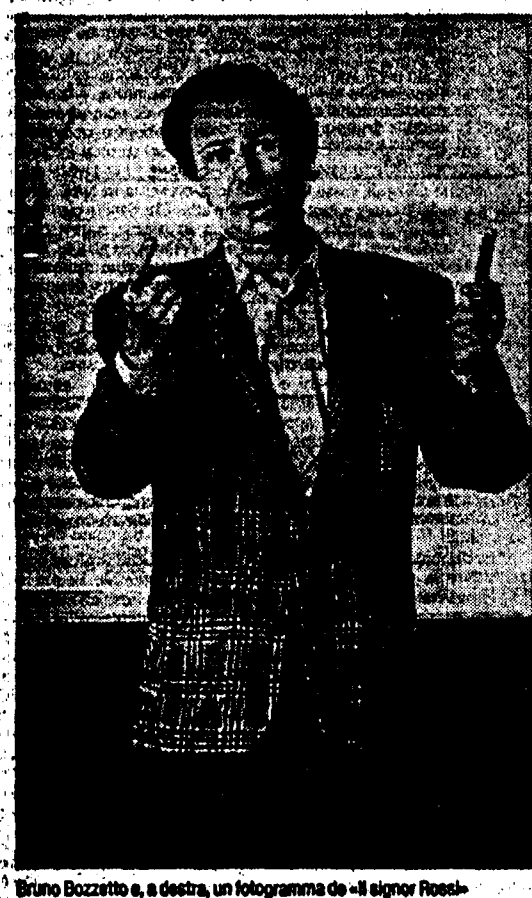
Bruno Bozzetto e, a destra, un fotogramma de «Il signor Rossi»