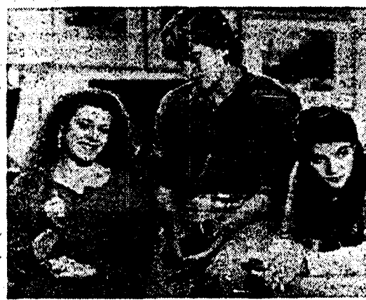
Una scena del «Ragazzi del muretto», da giovedì su Raidue.

Primo giro di prova, giovedì, per I ragazzi del muretto, prototipo di serial all'americana fabbricato da Raidue, proposto alle 20,30. 14 puntate, 4 registi, 9 sceneggiatori per raccontare in termini modulari le vicende di un gruppo di adolescenti romani. La chiave dell'«esperimento» sta nella parola che accomuna costi e ambizioni: mediobassa. Insomma, la risposta italiana a Forziè.