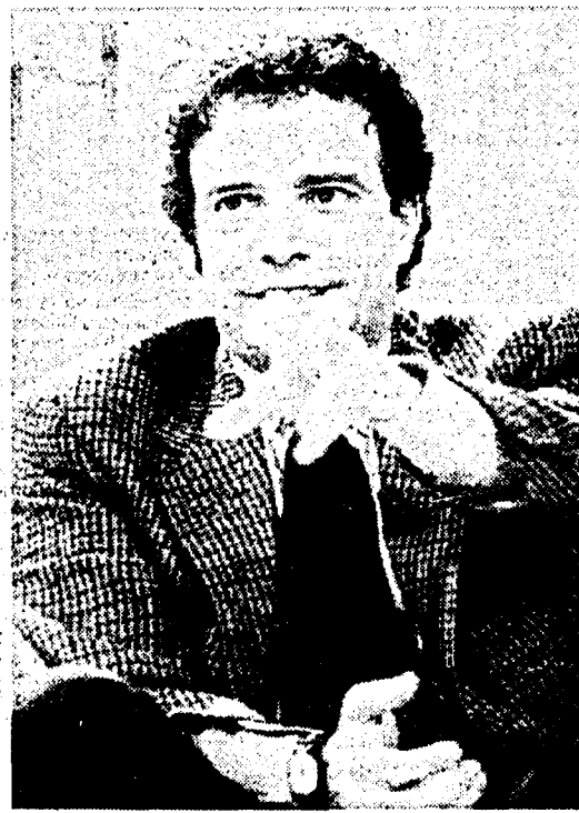
Enrico Montesano sarà professore di storia in tv

di cial, negli studi televisivi e in esterni, Enrico Montesano introdurrà il lavoro che ha svolto per S.P.Q.M. News, come si è calato nei diversi personaggi ai quali, se pure a modo suo, ridarà vita televisiva. L'attore, che per realizzare il programma sembra si sia chiuso in casa a riasudare la storia, racconterà le fasi della realizzazione della trasmissione. Un programma che, come dice lui stesso, «ha richiesto un notevole sforzo fisico e... mnemonico». Via via, nel corso delle settimane di «lezioni», lo incontreremo infatti nei panni di Muzio Scevola (e vedremo fino a che punto riuscirà ad emulare il suo spettacolare gesto auto-punitivo), in quelli dei fratelli Gracchi, come in quelli dei personaggi ormai leggendari che hanno popolato la storia di Roma, dalla sua fondazione al governo di Giulio Cesare. Un ventaglio di caratteri e personalità che l'attore ci vuol presentare (con la sua ironia) in tutta la loro attualità. Niente di pedante e noioso quindi. Così, anche per i problemi quotidiani degli antichi romani, Enrico Montesano avrà modo di trovare spunti per battute e agganci alla nostra epoca, racconterà aneddoti e curiosità paralleli con la storia di oggi. Uno tra i tanti, il problema del sovraffollamento urbano.