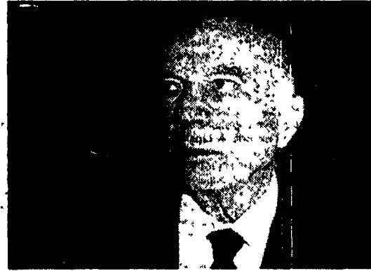
Il ministro del Tesoro Guido Carli

Le difficoltà sono sotto gli occhi di tutti, difficoltà davanti anche alla limitatezza delle risorse (10 miliardi di Ecu pari a 13 miliardi di dollari), tanto che la Berd si appresterebbe a decidere un incremento del capitale. La Berd può mettere in moto un meccanismo moltiplicatore di investimenti, ma non potrà che mobilitare al massimo - sostiene Attali - il 15% dei bisogni finanziari dell'Est.