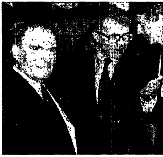
Il premier britannico Major con François Mitterrand, in alto Jacques Attali

Mitterrand «La prima istituzione della nuova Europa». Major: «Un obiettivo politico unico: la democrazia all'Est».