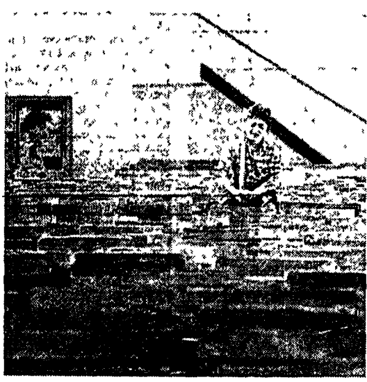
Una scena di «Piano piano Bokalstiz» di Tunc Basaran