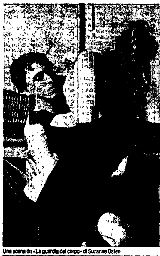
Una scena da «La Guardia del corpo» di Suzanne Osten