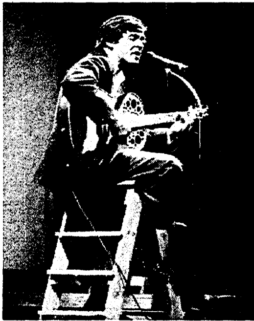
Gianni Morandi, due ore di canzoni domani su Italia 1

Da venticinque anni fa innamorare pensate e studentesse, da un anno e mezzo sta girando l'Italia con un tendone, una chitarra e la sua inconfondibile voce. Gianni Morandi - in compagnia di Red Ronnie - terrà banco domani sera in uno special su Italia 1, per la gioia di qualche milione di italiani: centotrentacinque minuti di canzoni e tenerezze, un pezzo di storia della «canzonetta» italiana.