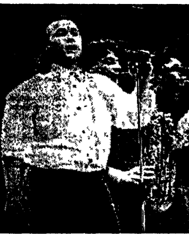
Il gruppo «Ladri di Biciclette»