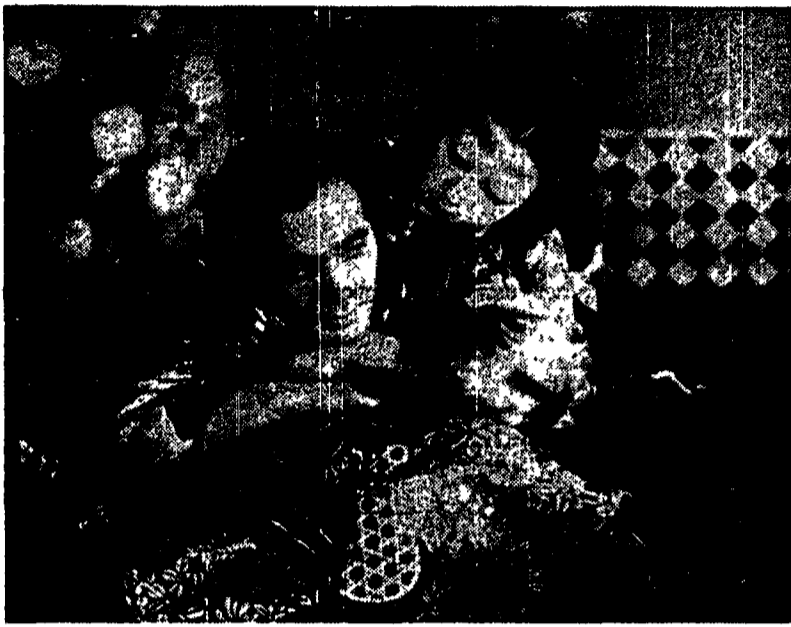
Masayuki Mori e Machiko Kyo in «I racconti della luna pallida d'agosto»

(1955) e La strada della vergogna (1956), che fu l'ultimo film del cineasta e sarà il unico, nel breve ciclo doppiato in italiano, mentre tutti gli altri saranno in originale con sottotitoli.