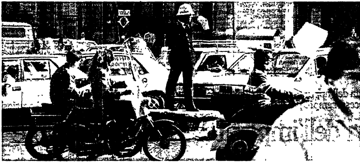
Un'immagine tipica: il vigile urbano in piazza Venezia

La «Lupa», la centrale operativa dei vigili urbani, da oggi rispetterà il «silenzio radio» per uno sciopero indetto dalla Cgil e dalla Uil. Funzioneranno solo le 4 linee telefoniche, mentre i canali radio per le comunicazioni interne resteranno accessi.