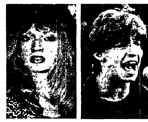
Da sinistra, la jugoslava Baby Doll e il cantante dei belgi Clouseau