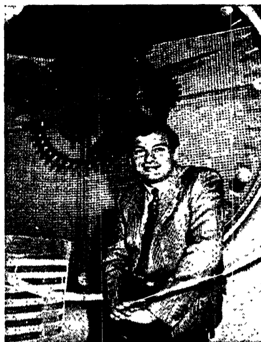
Oliviero Beha: da stasera lo rivedremo su RaiTre come conduttore del nuovo programma «Un terno al lotto»

lungo passato di giornalista della carta stampata (da Tuttosport a Repubblica dove nell'82 fa scoppiare il «caso Italia-Camerun» che gli costerà il posto), una carriera televisiva discontinua. Beha torna stasera in tv, su RaiTre, per il nuovo programma Un terno al lotto, una specie di agenzia di collocamento con la doppia ambizione di divertire e essere utile. Una trasmissione, oltretutto, che potrebbe benissimo diventare «permanente». «Un terno al lotto» è ancora una volta un programma che non c'entra nulla con il tuo passato. È un caso o un progetto? Che ho rinunciato scientemente a fare il giornalista sportivo,