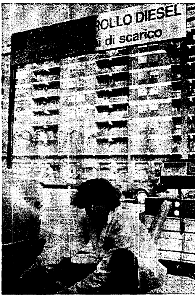
Controllo del gas di scarico: il 15 maggio scade il termine per la verifica di tutte le vetture con permesso di circolazione per il centro storico.

tro storico in odor di trasgressione, oltre alla multa di centomila lire, si vedranno sequestrare il permesso stesso. Per riaverlo, dovranno dimostrare di aver fatto controllare i fumi dei tubi di scappamento della propria auto. Dove? Ufficialmente, i centri Fiat hanno prorogato fino al 31 dicembre le verifiche gratuite. Ma la confusione e la mancanza di informazioni regna sovrana nelle officine: c'è chi si dice disponibile alla proroga, chi spiega che bisognerà pagare (15-20 mila lire), chi ha finito addirittura i bollini e rimanda l'appuntamento a tempi migliori. Eppure, la Fiat e il Campidoglio non si erano risparmiati in pubblicità e propaganda. Tutte le auto (benzina e diesel) immatricolate prima di gennaio 1990, avrebbero potuto farsi controllare i tubi di scappamento. Una questione di coscienza ecologica, nessun obbligo per gli automobilisti, a