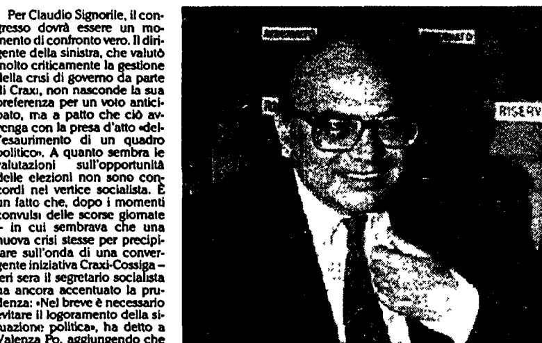
Il segretario socialista, Bettino Craxi