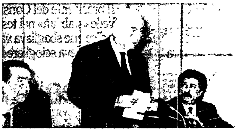
Francesco Cossiga durante il suo intervento