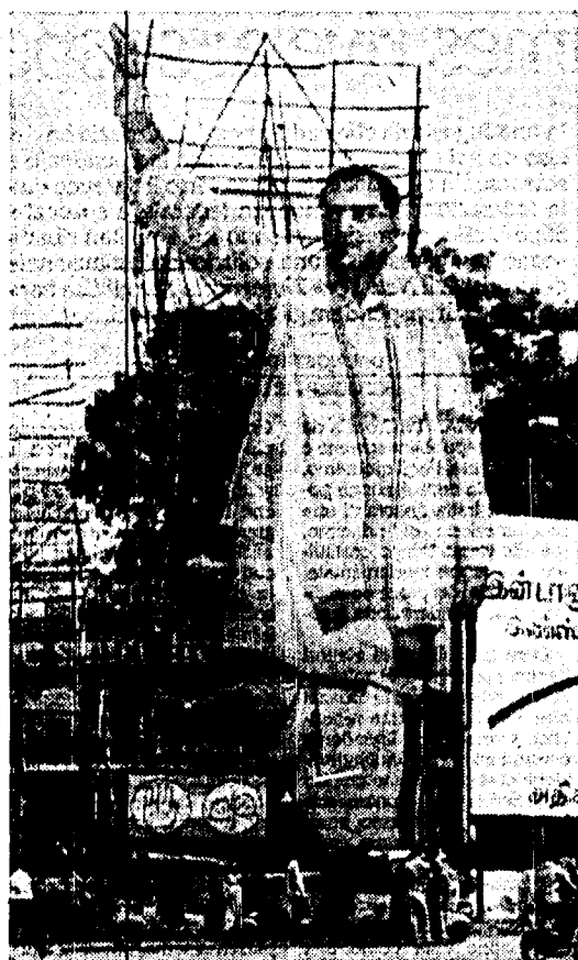
Un cartellone elettorale con l'immagine di Rajiv Gandhi in una strada di Madras

Il voto del 1984 assicurò il trionfo a Rajiv Gandhi, quello del 1989 gli procurò una clamorosa débacle. Le elezioni di questa settimana (tre turni fra oggi, giovedì e domenica) potrebbero, secondo alcuni osservatori, sancire il ritorno al timone dell'immenso paese asiatico.