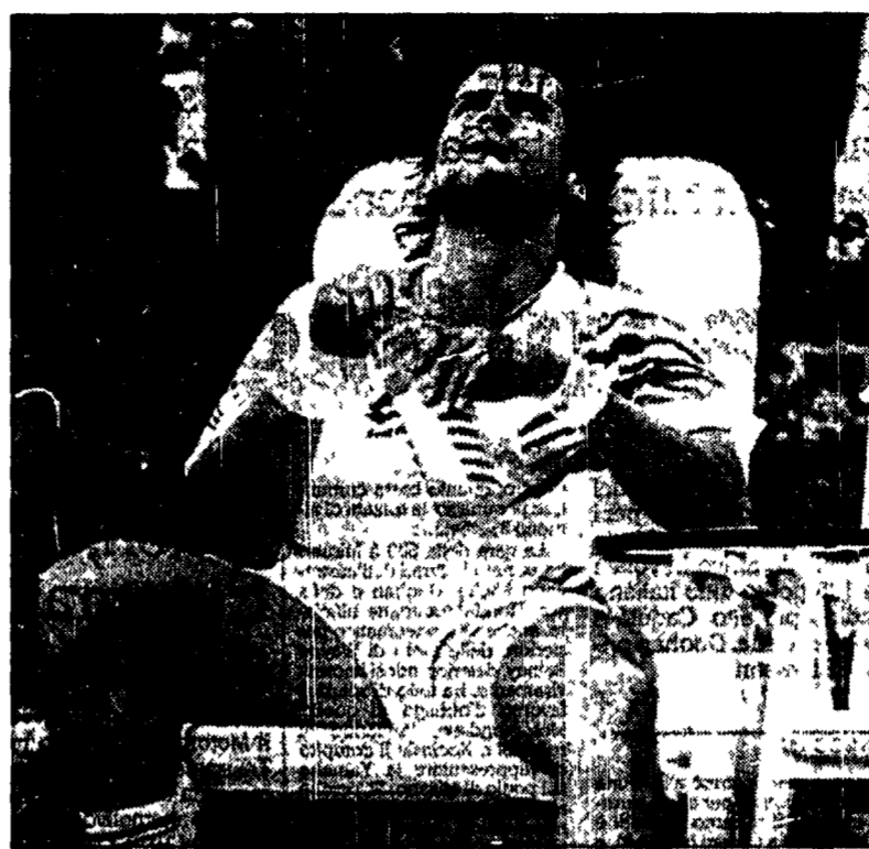
Alberto Mancini dolente e sconcolato prima di arrendersi a Roma aveva vinto nell'89