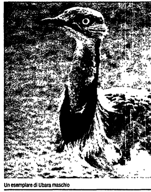
Un esemplare di Ubara maschio

Raiuno Otto speciali dedicati all'Europa