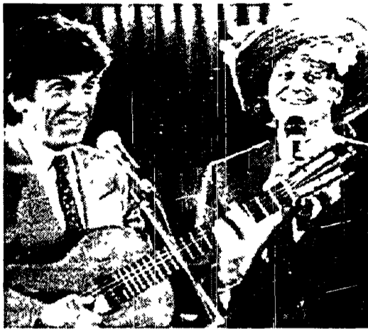
Gigi Proietti e Renzo Arbore in «Concerto inedito»