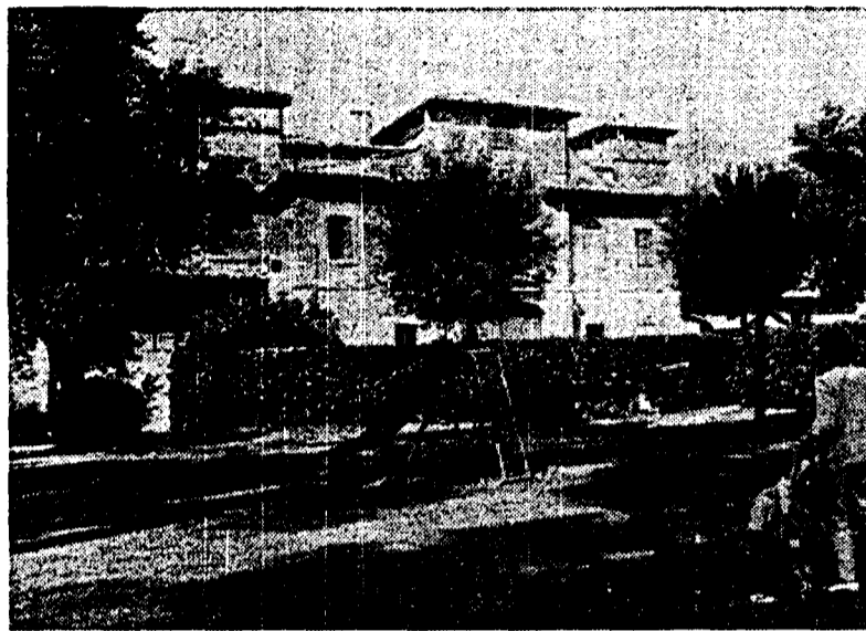
Una veduta di Villa Carpegna

I locali in questione, di 1.200 metri quadrati, erano destinati a una biblioteca e a un centro polivalente. Pronti da dieci an-