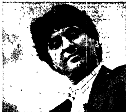
Gianni Ippoliti torna in tv

condotto da Davide Mengacci, ha collaborato al varietà Scommettiamo che? condotto da Fabrizio Frizzi su Raiuno e per Raitre ha realizzato Festiva-ballo , un montaggio di aspiranti cantanti «raccomandati» alle varie manifestazioni canore italiane. Ippoliti conclude «Non è mai troppo tardi» è un programma ruspante, praticamente fatto in casa con mezzi estremamente poveri. Però da questa esperienza vorrò trarre qualcosa, per esempio vorrei pubblicare il Nuovissimo Ippoliti della lingua italiana parlata».