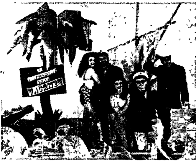
I comici napoletani «Trettré». Li vedrete da stasera su Canale 5 nel «Tg delle vacanze», quindi minuti di parodie estive che prendono il posto del programma di Antonio Ricci con Ezio Greggio e Raffaele Pisù.

Ed eccoci arrivati al dunque. «Striscia» ha preso la via del mare e ha lasciato non la sua eredità, ma il suo spazio. Ci sarà pure l'Italia rimasta in campagna? Ora, chiunque abbia lavorato in un giornale d'estate, sa che il notiziario agostano percorre desolatamente pochi collaudatissimi