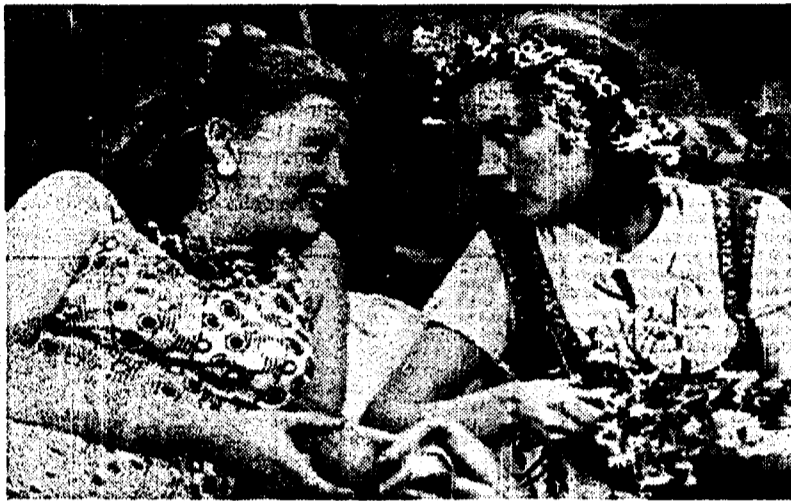
Irina Muraveva e Vera Alentova in una scena da «Mosca non crede alle lacrime»

C'è spazio, in Urss, per del film sovietici commerciali? Non c'è il rischio che i film americani si «mangino» il 90 per cento degli incassi?