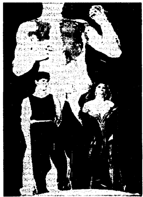
LA PISCINA DI ALBA PARIETTI. Alba Parietti (nella foto) allo Stadio dei Marmi di Roma mentre sta girando la sigla per la trasmissione La piscina...