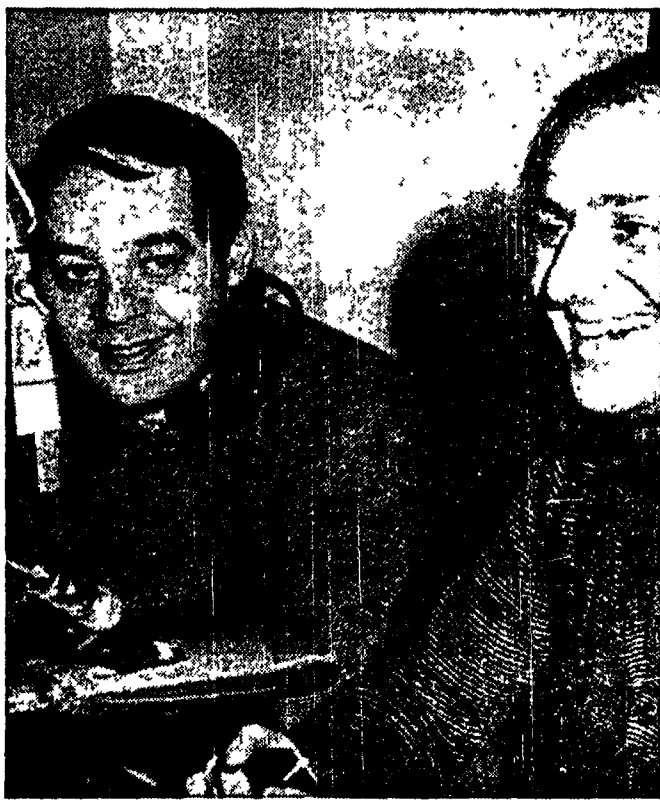
Li avete riconosciuti? Sono Gianni Boncompagni e Renzo Arbore ai tempi di «Alto gradimento», una delle più popolari trasmissioni della radio Rai.

Dopo trent'anni di Rai, Gianni Boncompagni ha accettato le offerte di Silvio Berlusconi e ha firmato un contratto triennale per la Fininvest. «Non mi sento affatto un "venduto", forse un po' traditore. Ma non sparò dalla circolazione e non mi farò sopraffare dai consigli per gli acquisti». Il suo segreto? Bassi costi e niente sprechi. La sua più grande nostalgia? La radio, che è più bella della televisione.