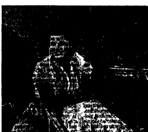
Claretta Petacci nella sua villa nel 1940