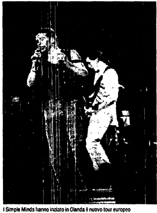
Simple Minds hanno iniziato in Olanda il nuovo tour europeo

I Simple Minds hanno aperto a Heerenveen, cento chilometri da Amsterdam, il loro nuovo tour europeo. Messi da parte messaggi sociali e politici, Jim Kerr e compagni mostrano oggi un volto più immediato e diretto.