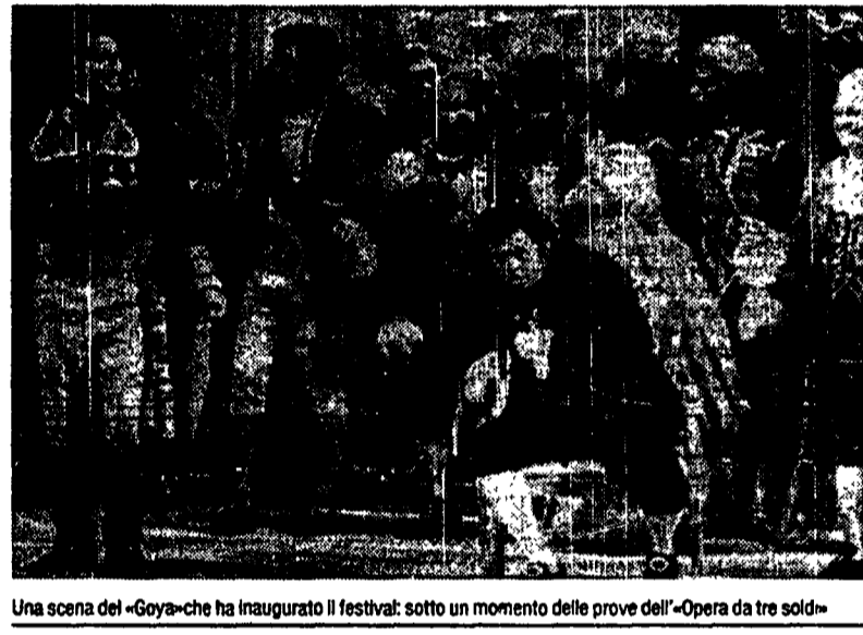
Una scena del «Goya» che ha inaugurato il festival: sotto un momento delle prove dell'«Opera da tre soldi»

Spoleto. «Complimenti Maestro». «Buon festival, Maestro». Lo hanno aspettato sotto casa per gli ultimi auguri prima del «via» ufficiale. Lui è sereno, serafico e pieno di humour come sempre.