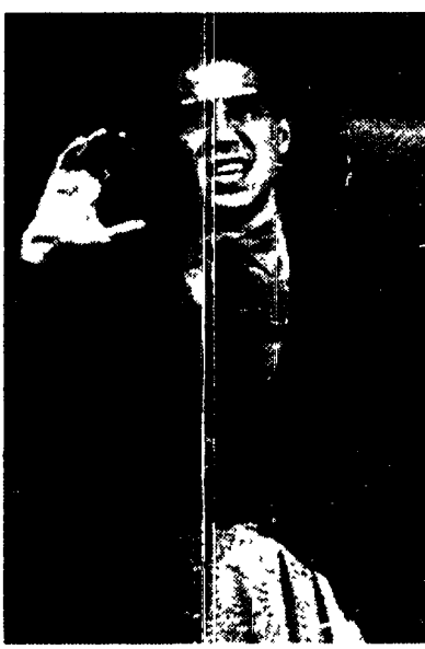
Adriano Celentano sarà stasera a «Notte rock»

ROMA. Versione «stiva di Notte rock in compagnia del re degli ignoranti», alias Adriano Celentano. Il cantante, infatti, ha scelto la trasmissione musicale di Raiuno per organizzare il suo rientro in tv dopo quattro anni di assenza. L'ex mattatore di Fantastico però non ha ancora deciso quando apparirà in video di persona (un'apparizione che preannuncia altre provocazioni via etere) e ha così pensato di ingannare l'attesa presentando alcuni «messaggi» preprodotti. Questa sera, ore 23 in testa alla sigla, un'estratto da una canzone del suo ultimo album, «Il re degli ignoranti», introduce una dichiarazione («Il re degli ignoranti ha deciso di rompere il silenzio e i monologhi di Fantastico, al confronto, erano roba rassicurante...») e un appello rivolto ai giovani letto da due bambini: «Studiate con il cuore. Spero che gli studenti prendano sulle spalle il mondo. E sul video scorrono le immagini dei bambini che hanno vissuto gli orrori della guerra in Irak e il dramma dei curdi.