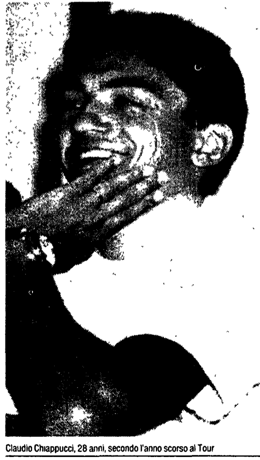
Claudio Chiappucci, 28 anni, secondo l'anno scorso al Tour