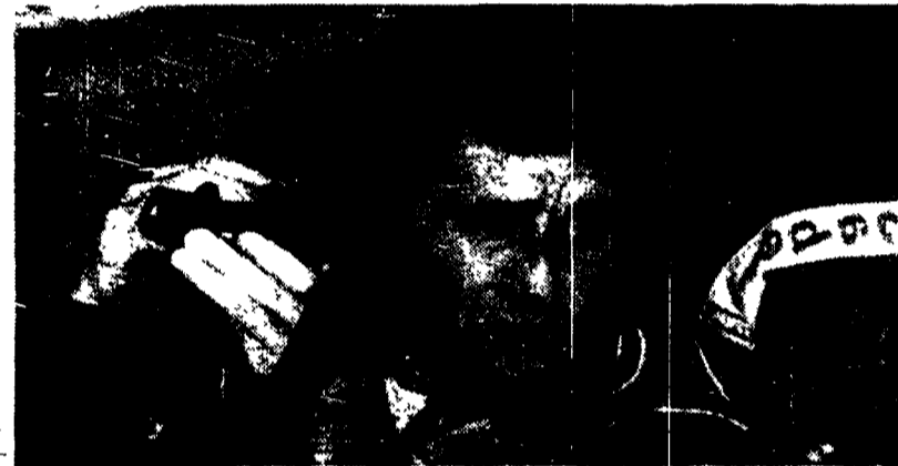
Alain Prost prova il nuovo volante della 643: le prime prove in Francia sono andate bene