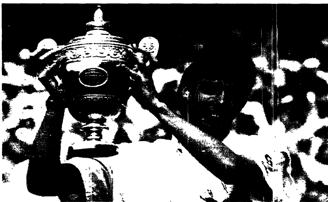
Michael Stich, 23 anni, mostra orgoglioso il trofeo dopo aver vinto il suo primo torneo del Grande Slam...

Derby tedesco a Wimbledon Pronostico frantumato: Stich umilia Becker già vincitore tre volte sull'erba inglese