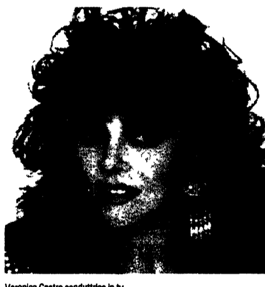
Veronica Castro conduttrice in tv

«Cercando di riassumere gli interventi ospitati nel mensile», dice Ermanno Detti che ha curato questo numero - si può dire che non esistono più gli «apocalittici» e gli «integrati» analizzati da Umberto Eco ma una linea comune di pubblico che riconosce una tv buona e una cattiva. Ovviamente si vuole quella «buona» che possa servire anche da supporto per le conoscenze dei ragazzi. «Vista la carenza e l'arretratezza del sistema scolastico italiano» - aggiunge Roberto Maragliano, vice direttore della rivista - «si dovrebbe iniziare a pensare lo schermo come luogo nuovo e privilegiato per la conoscenza da parte dei bambini». L'importante però conti non è usare bene la tv «i programmi realizzati dal Dsc, nato in accordo col ministero della Pubblica Istruzione, non hanno saputo utilizzare lo specifico televisivo come invece un programma come la striscia «scolastica» di Ippoliti». Walter Veltroni ha concluso che «è necessario un progetto di tv per ragazzi come esisteva un tempo che non sia però la fotocopia di quello delle emittenti private che comprano unicamente cartoon giapponesi». E una tv senza pubblicità nei cartoni animati.