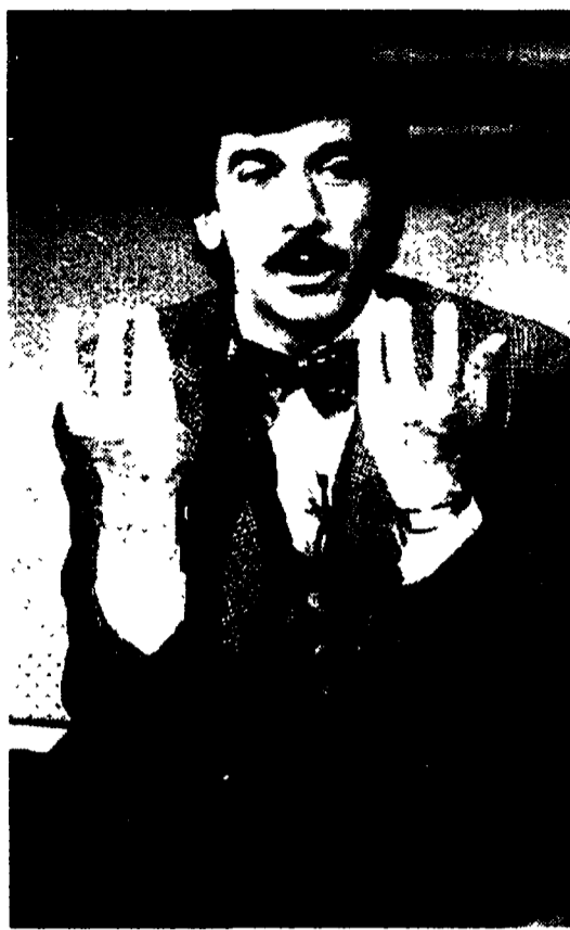
Marco Columbro torna a fare l'attore