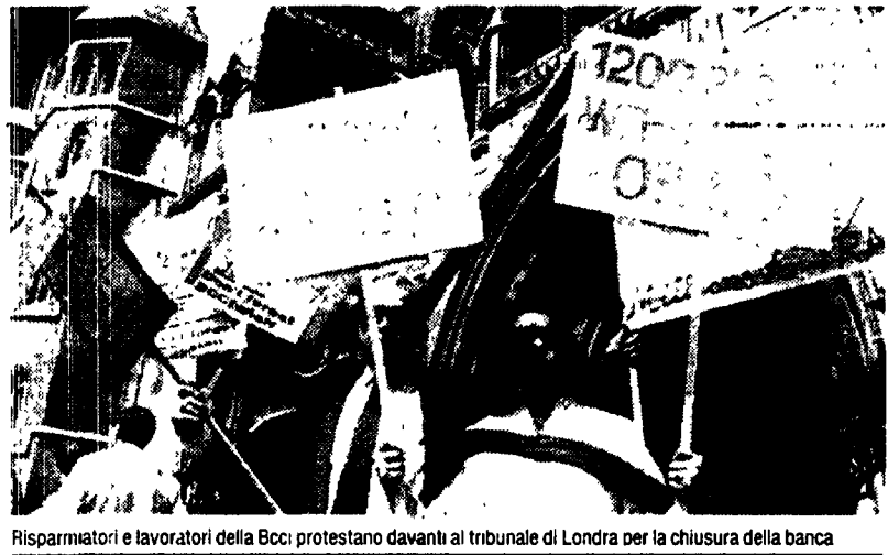
Risparmatori e lavoratori della Bcci protestano davanti al tribunale di Londra per la chiusura della banca