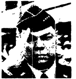
Colin Powell è a Mosca per discutere di armamenti