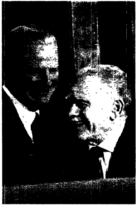
James Baker durante l'incontro con il Primo ministro israeliano Shamir