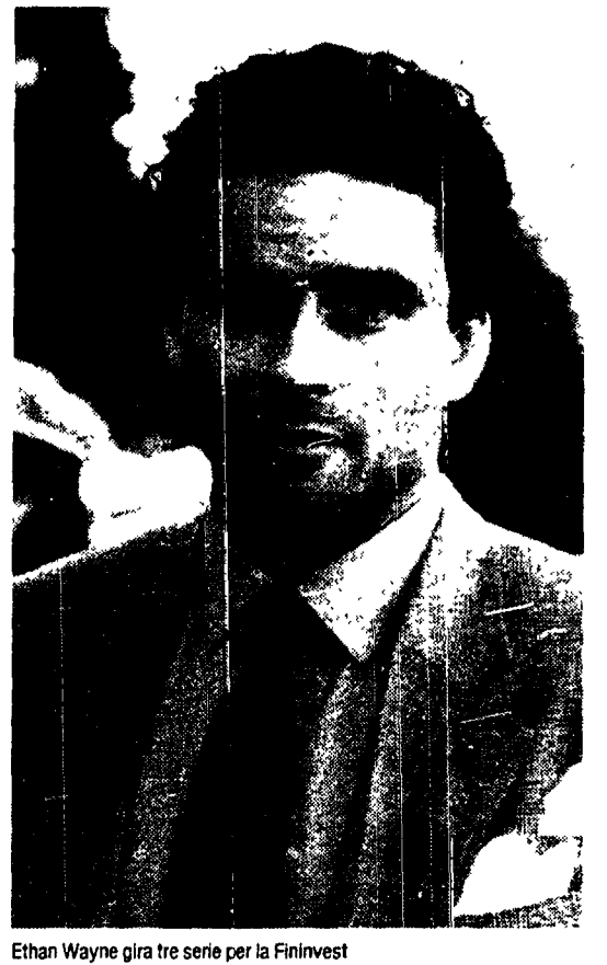
Ethan Wayne gira tre serie per la Fininvest

Con il successo di Beautiful, così come gli altri interpreti della celebre soap-opera, Ethan Wayne ha trovato in Italia la sua America (dove invece non riesce a sfondare). Per la Fininvest, Wayne girerà infatti prossimamente anche Assassino al palo, un giallo in due puntate ambientato a Siena e ancora, Madre Russia, un kolossal storico che racconterà le vicende di una famiglia sovietica in 40 anni di storia e di rovesci politici.