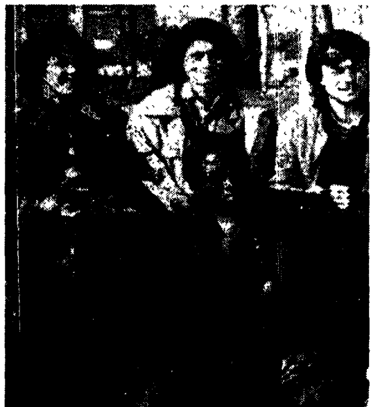
Una scena del telefilm di Raidue «I ragazzi del muretto»

TOPVENTI (Italia 1, 23.30). Notte in compagnia dei Simple Minds, ospiti del programma di attualità musical, condotto da Emanuela Follivero. Seguiranno le interviste a Cino Paoli, Mario Castellanou e Spagna.