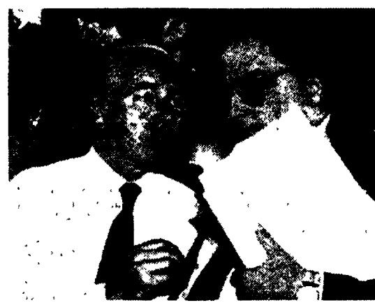
Gianni De Michelis con il ministro degli Esteri jugoslavo Loncar

L'Europa per cercare di scongiurare il pericolo di una guerra civile. «O riusciamo a utilizzare la moratoria concordata a Brioni per trovare una soluzione duratura oppure sarà il caos», ha detto ad Andreotti e De Michelis nel corso dei due incontri che ha avuto con loro.