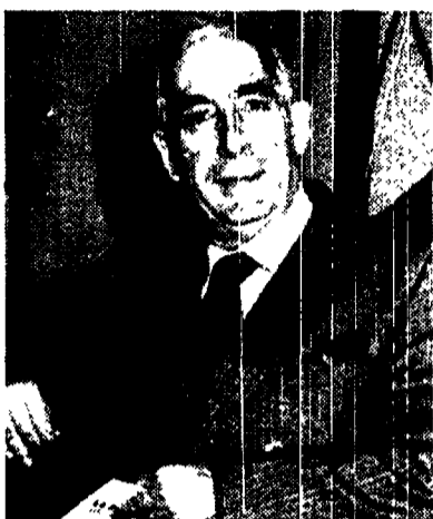
Gianuario Carta presidente della commissione d'inchiesta sulla Bnl

Lo scandalo Bnl-Irak si allarga. La conferma viene dal presidente della Commissione d'inchiesta Gianuario Carta secondo il quale «operazioni non dissimili e per importi cospicui vedrebbero interessati altri paesi».