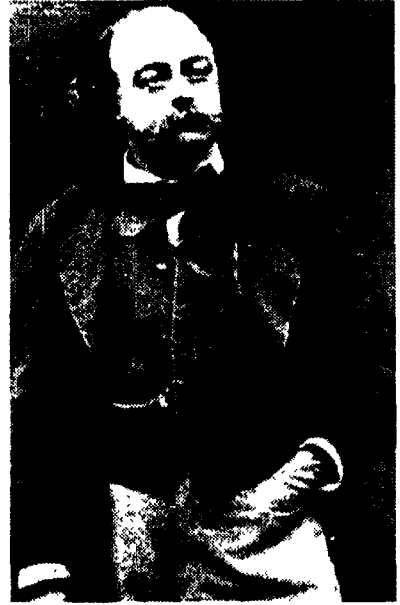
Lo scrittore francese Gustave Flaubert; accanto, la copertina di «Bouvard e Pécuchet» nell'edizione Claudine Gohl-Mersch