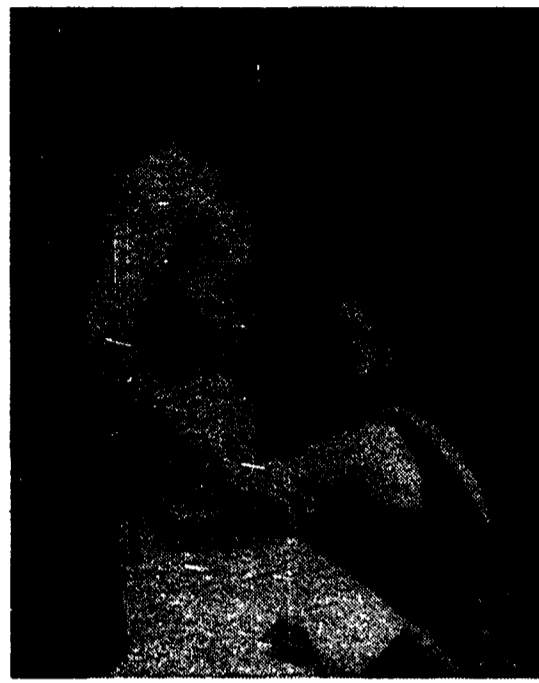
«Venice California», da una foto del libro