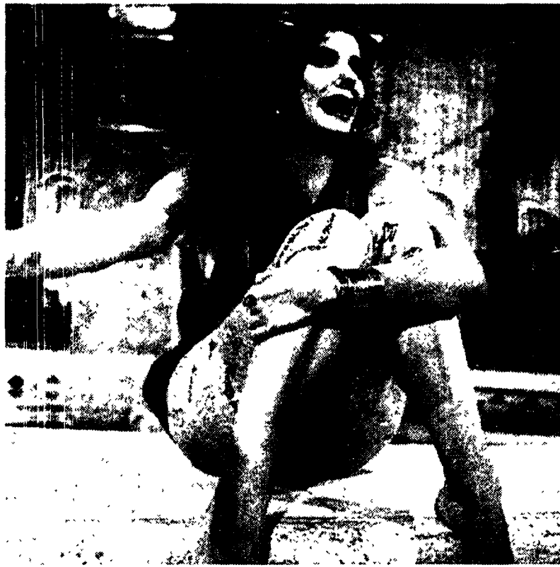
«La piscina» di Alba Parietti galleggia sul 14% di share