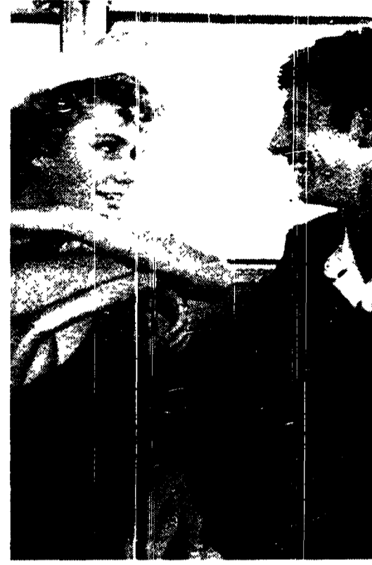
Una scena del film «L'intervista», di Fellini, salvato dall'interruzione del tg di mezza sera. Accanto, i Tiny Toon, che andranno in onda su Canale 5: senza spot