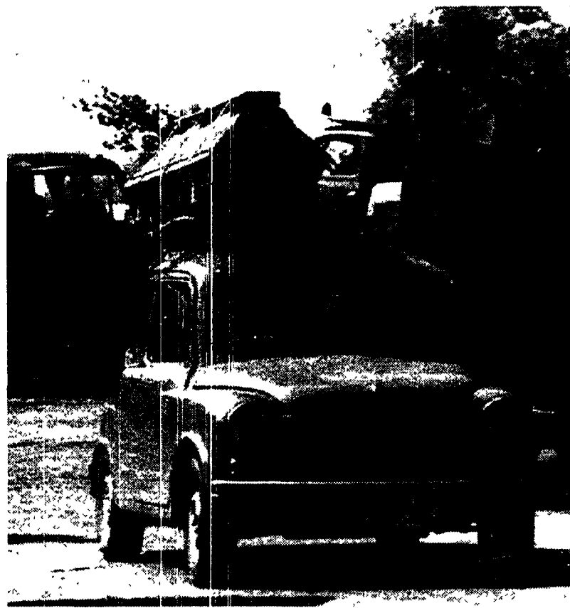
Un abitante croato di Osijek fugge dal suo villaggio portando con sé la bara di un suo congiunto rimasto ucciso durante un attacco dei ribelli serbi

za, si stavano preparando per fronteggiare l'attacco finale delle milizie serbe.