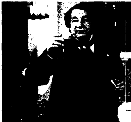
Philippe Noiret in «Rossini, Rossini» di Mario Monicelli