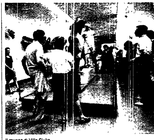
Il museo di Villa Giulia

Si contano sulle dita di una mano i musei e le gallerie romane e laziali, le ville e i monumenti che, grazie all'arrivo dei custodi «trimestrali», sono riusciti a prolungare l'orario di apertura. Invece, in stagione di vacanze, da viaggi premio per i migliori acquirenti. Quest'anno, per chi in agosto ha comprato almeno cinque milioni di oggetti, c'è una settimana in Tunisia. Gli arabi scorsi, ci sono stati viaggi a Vienna e nelle Baleari.