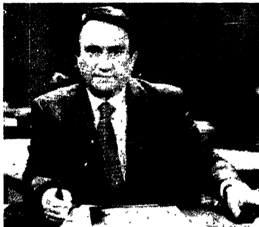
Emilio Fede. In alto a destra, Enrico Mentana