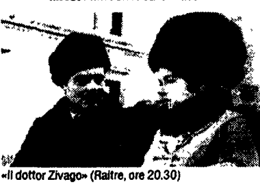
«Il dottor Zivago» (Raitre, ore 20.30)