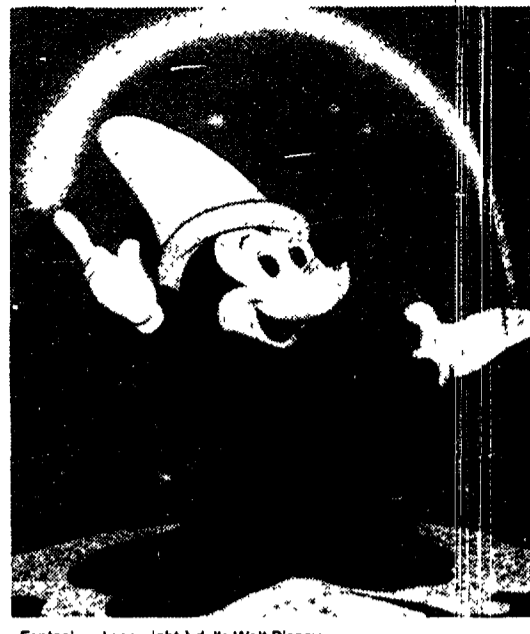
«Fantasia»; il copyright è della Walt Disney