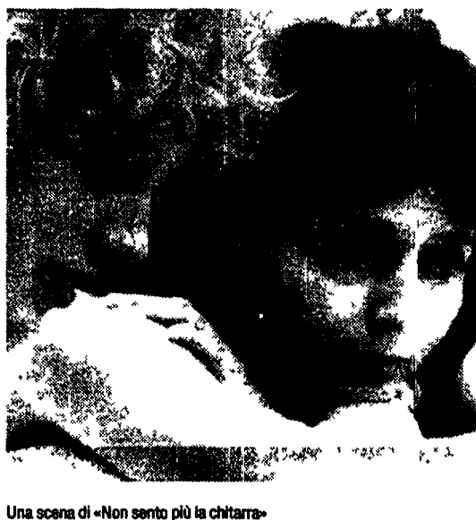
Una scena di «Non sento più la chitarra»

Jim Morrison e Nico, le cantanti del Velvet Underground erano grandi amici, e la versione che Nico eseguiva di The End, la canzone più famosa dei Doors (quella che apre Apocalypsis Now di Coppola, per intenderci) era ruba da brividi. E allora, direte voi? E allora, è piuttosto singolare che mentre esce nel cinema italiano The Doors di Oliver Stone (ne parliamo nella pagina accanto) Raitre programmi stasera alle 23.25 un film come J'entends plus la guitare (alla lettera, «Non sento più la chitarra») che si ispira sia pure vagamente alla vita di Nico. La curiosità è doppia, perché il film, diretto dal francese Phi-