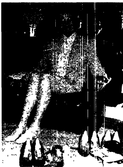
Frank Sinatra durante il suo show e, accanto, la moglie Barbara mentre rinnova in un negozio di Milano