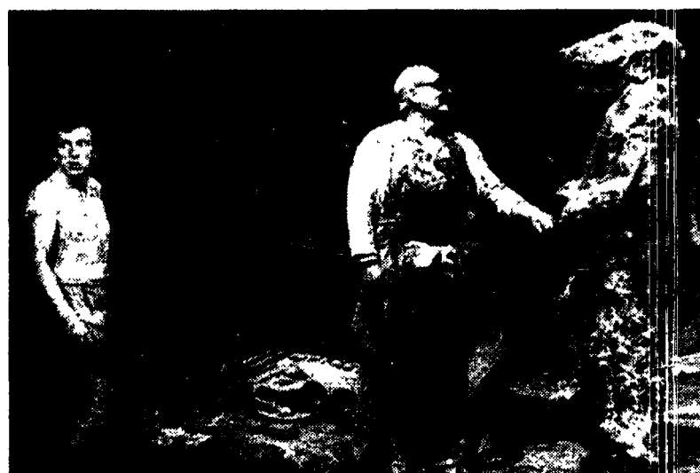
Una scena dell'«Ubu Rex» andato in scena a Firenze nell'ambito della rassegna Intercity